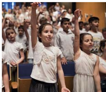
14.570 Düsseldorfer Grundschüler erfüllten die Tonhalle mit fröhlichem Chorgesang.

Eindrucksvoller lässt sich eine aufmunternde Mahnung an Bildungs- und Kulturpolitiker zu neuen Anstrengungen für die musische Grundbildung der Kinder kaum vorstellen: In genau 18 Konzerten haben 14.570 Düsseldorfer Grundschul-kinder vor Beginn der Sommerferien die Düsseldorfer Tonhalle mit fröhlichem Chorgesang gefüllt. Es war nach elf Jahren der bisher größte Abschluss der einmaligen Musikförderungsaktion Sing-Pause, die seit 2004 vom Städtischen Musikverein der Landeshauptstadt gemeinsam mit der Stadtverwaltung und tausenden freiwilliger, ehrenamtlicher und fördernder privater Unterstützer organisiert wird. Es geht um musikalische Bildung in der Grundschule. Und die wird vom Musikverein der Landeshauptstadt so durchgreifend wie nirgends sonst in Deutschland angeboten. Kürz-