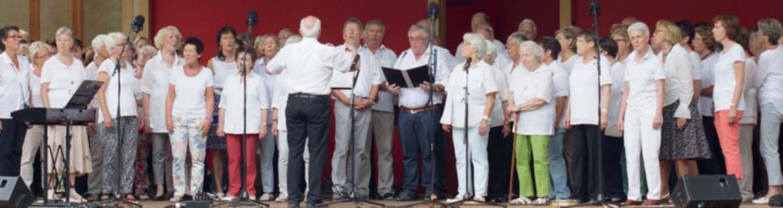
Oben und links: Flott bei der Sache - die „Silver Singers“ aus Paderborn.