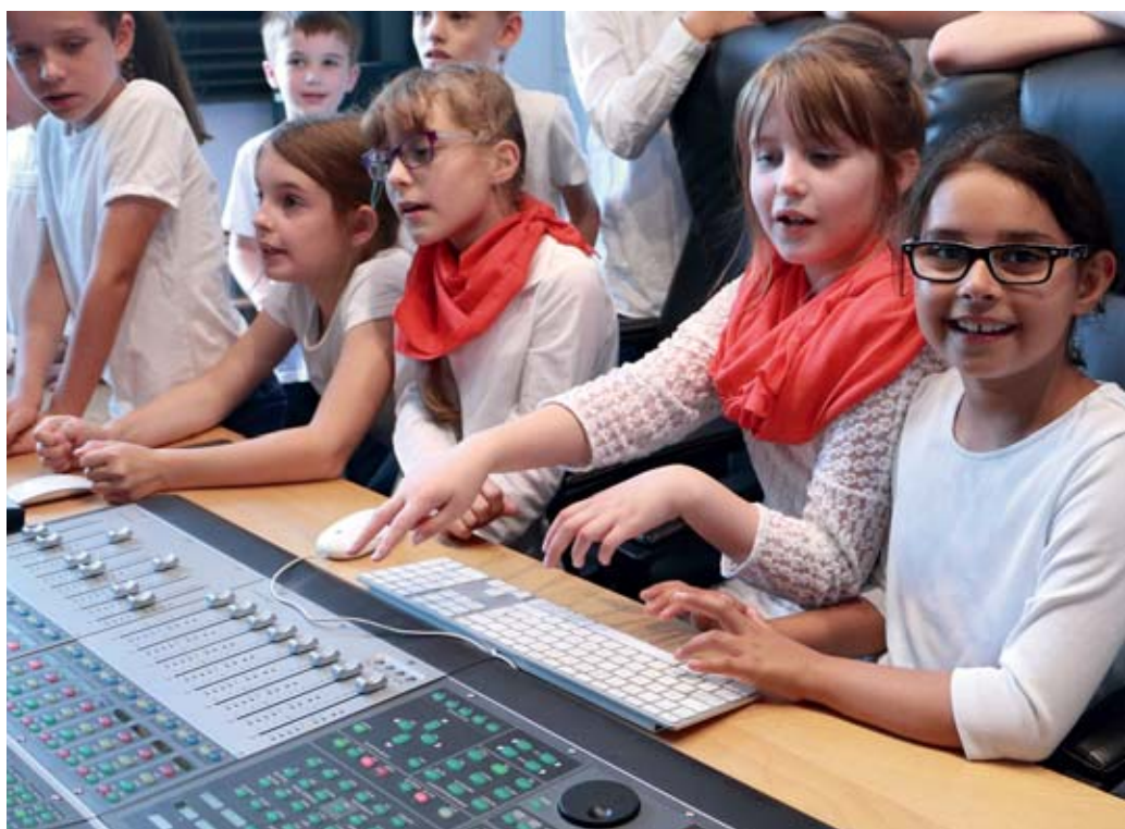
Auch die Kinder mischen bei den Tonaufnahmen mit.