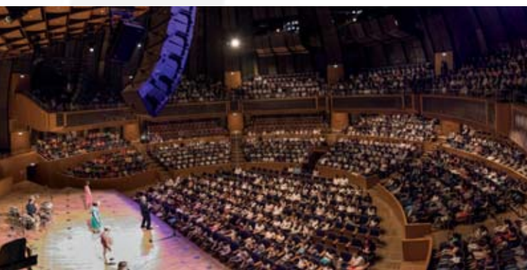
Momentaufnahme aus dem Konzert am 1. Juni in der prall gefüllten Düsseldorfer Tonhalle

Wir erstellen Ihre Website direkt am Telefon: 061 31 / 22 64 74 53 oder unter blankchoir.org