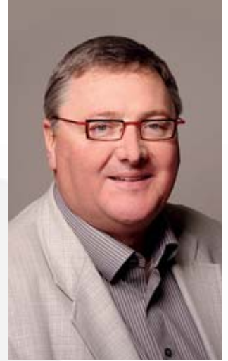
Autor Helmut Pieper

Bis zum nächsten Mal, Ihr/Euer Helmut Pieper