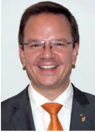
Autor Christoph Krekeler