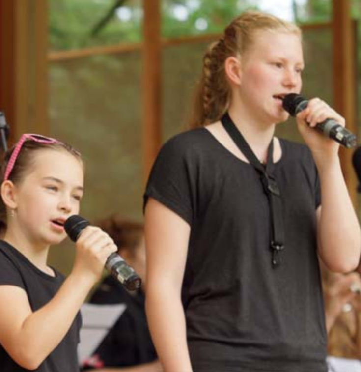
Kinderstimmen auf der Chorbühne der Landesgartenschau