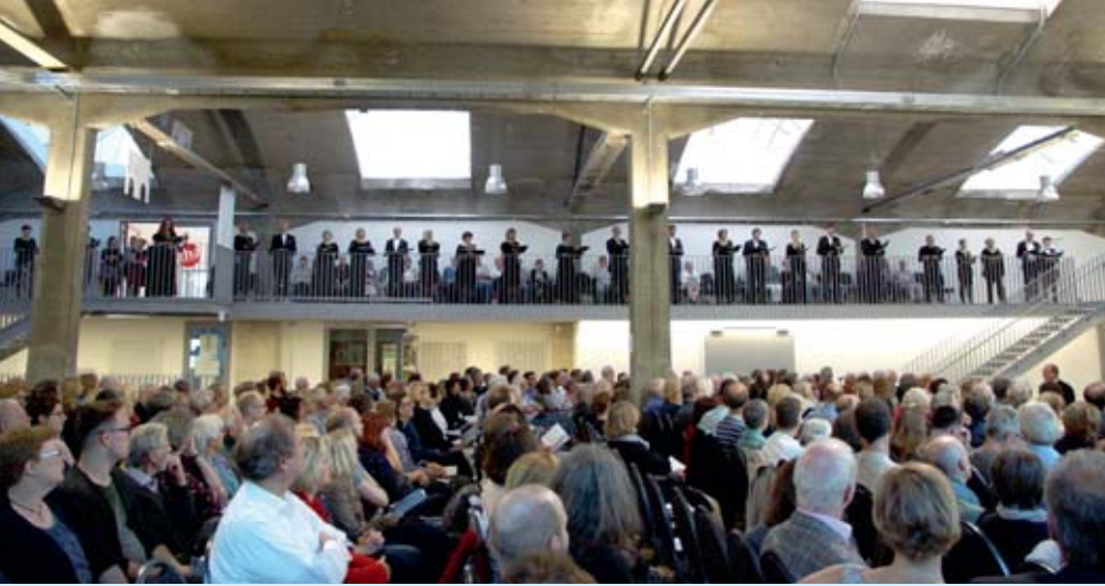
Szenenvielfalt von der Internationalen Chor-Biennale Aachen – Menschen dicht gedrängt unter der Sonne draußen vor dem Dom, aufmerksam auch drinnen.