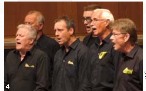
1. Konzentriert im Konzert, Jubelstimmung danach draußen: der MGV Bremcke „The Four Valleys“. 2. Fröhliche Sängerinnen des Chores Nova Cantica Wenden/Möllmicke. 3. Die Meistersänger vom MGV 1864 Velmede. 4. Auftritt von „Intermezzo - Gemischer Chor Kreuztal-Langenu“.